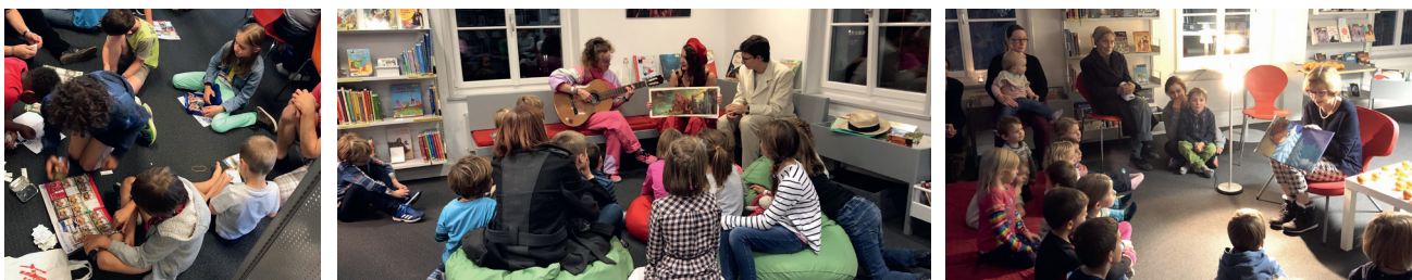
Paninibilder-Tausch / Erzählnacht mit der Theatergruppe fabulant / Adventsgeschichten für die Kleinen