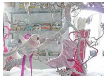
Plakate zum Thema «Illetrismus» / der claro-Weltladen zu Gast / Weihnachtsstimmung von Simone Quarella